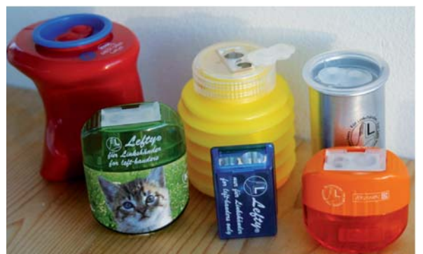
Spitzer, von links nach rechts: 1 Kum (für den therapeutischen Bedarf), 2 – 4 Kum, 5 + 6 Brunnen

Das Linkshänder-Lineal hat die Skalierung von rechts nach links und ermöglicht linkshändigen Kindern gleiche Chancen beim Messen und Zeichnen. Denn damit können in der natürlichen Arbeitsrichtung Messungen vorgenommen und Striche gezogen werden.