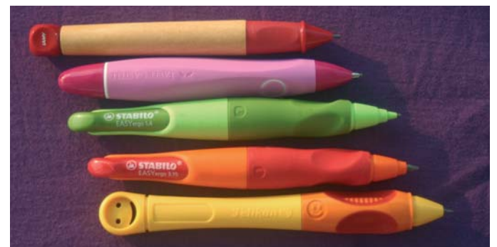
Lamy ABC Druckbleistift, Faber-Castell Drehbleistift, Stabilo EASYergo 1.4, Stabilo EASYergo 3.15, Pelikan Griffix