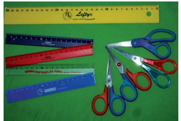
Lineale, von oben nach unten: 1 – 4 Kum, 5 Brunnen; Scheren, von oben nach unten: Staedtler, Brunnen, Kum rund und spitz